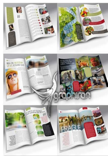
Modern Magazine Indesign Template (INDD,11X) www.graphiran.com

رسانه های جمعی عامل قدرتمندی برای برقراری ارتباط شکل دهنده ارزش ها و فراهم آورنده دانش هستند. در این راستا بررسی با عنوان "میزان اختصاص یافته به بخش ارتقای سلامت در نشریات پر فروش و پرتیراژ تهران" در سال ۱۳۹۲ انجام شد که شامل کندوکاو در ۲۶ مجله بود. برای انتخاب مقالات ارتقای سلامت در این مجموعه، نشریات به دو دسته خانوادگی، اطلاعات عمومی و نشریات خانوادگی، پزشکی تقسیم گردیدند. نتایج نشان داد که از کل نشریات